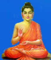
గురు గౌతమీ బుద్ధ